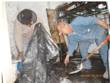
Arreglo y mantenimiento del Reloj (Plaza Principal)