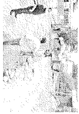
El alcalde Heriberto Treviño Cantú supervisó las obras de vitalidad, pluviales y bacheo en el municipio de San Felipe.

El alcalde Heriberto Treviño Cantú, supervisó las obras de vitalidad, pluviales y bacheo en el municipio de San Felipe. Durante su recorrido, el alcalde se reunió con los responsables de las obras y les entregó instrucciones para que se cumplan a tiempo y con calidad. El alcalde destacó la importancia de estas obras para mejorar la infraestructura de la ciudad y garantizar la seguridad de los ciudadanos.