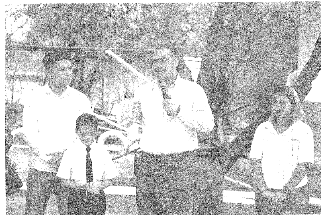
Lic. Heriberto Treviño Cantú, alcalde dando su mensaje en el evento de la rehabilitación de un plantel escolar en el municipio de Juárez.

practicar algún deporte, en fin cambió totalmente este plantel educativo, es una comunidad de las más antiguas de nuestro municipio, la gente siempre está en la mejor disposición de participación y es lo que buscamos integrar la sociedad con el gobierno para juntos lograr estos objetivos”, finalizó Heriberto Treviño Cantú.